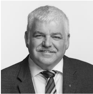
Ständerat Othmar Reichmuth, Illgau, Präsident